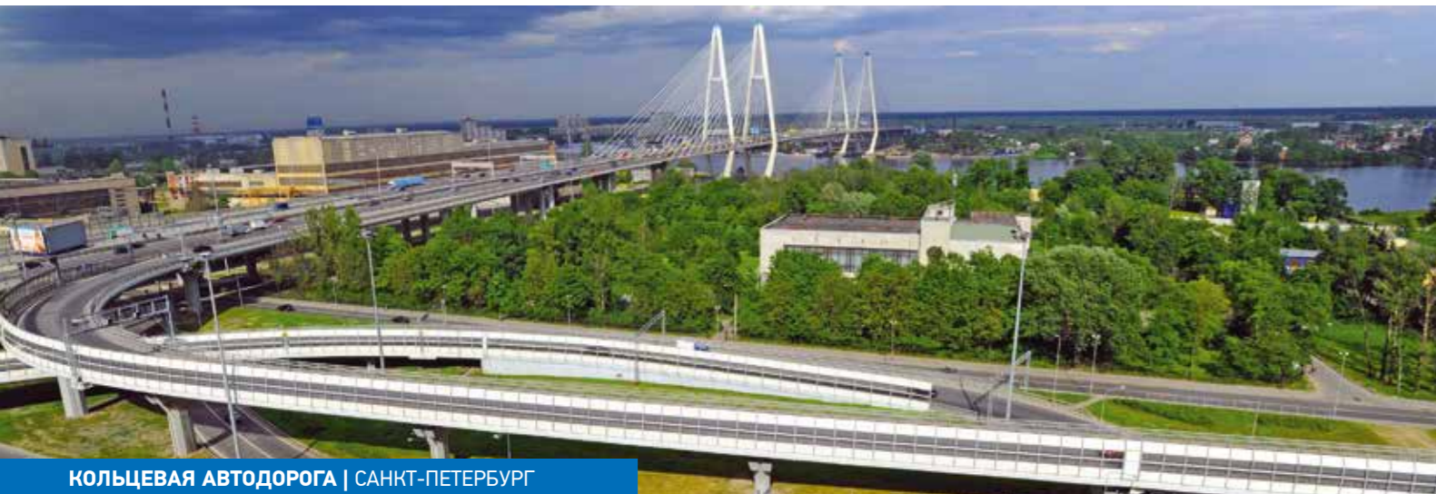
КОЛЬЦЕВАЯ АВТОДОРОГА | САНКТ-ПЕТЕРБУРГ

ИНЖЕНЕРНАЯ ГРУППА «СТРОЙПРОЕКТ» — лидер дорожной отрасли России в сфере комплексного проектирования и строительного контроля.