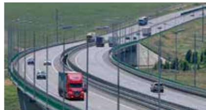
АВТОМОБИЛЬНАЯ ДОРОГА М-4 «ДОН»

Реконструкция магистрали направлена на улучшение транспортной связи центральных регионов России с югом страны. В ходе масштабных работ предусмотрено увеличение пропускной способности магистрали, в том числе за счет создания обходов населенных пунктов и вывода из них транзитных потоков. Комплекс реализуемых мероприятий позволит сократить время в пути, повысит безопасность дорожного движения и сделает дорогу более комфортной для водителей и пассажиров.