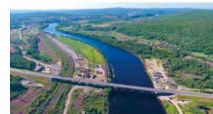
КОМПЛЕКСНОЕ РАЗВИТИЕ МУРМАНСКОГО ТРАНСПОРТНОГО УЗЛА | МУРМАНСК

На первом этапе реализации проекта «Стройпроект» осуществляет строительный контроль за строительством новой электрифицированной однопутной железнодорожной линии по маршруту ст. Выходной — мостовой переход через р. Тулома — ст. Мурмаши II — ст. Лавна протяженностью 46 км. Пропускная способность нового участка железной дороги составит не менее 28 млн т в год.