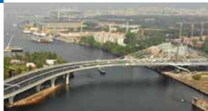
МОСТ БЕТАНКУРА САНКТ-ПЕТЕРБУРГ