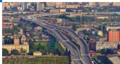
ЗАПАДНЫЙ СКОРОСТНОЙ ДИАМЕТР САНКТ-ПЕТЕРБУРГ

Объекты транспортной инфраструктуры в Сочи, в создании которых приняли участие специалисты Инженерной группы «Стройпроект»: • Дублер Курортного проспекта (с общей протяженностью тоннелей 12,5 км) • Мост через р. Сочи • Автодорожный обход Сочи • Автодорожные развязки: «Стадион» и «Аэропорт»