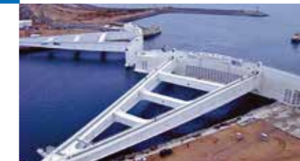
КОМПЛЕКС ЗАЩИТНЫХ СООРУЖЕНИЙ ОТ НАВОДНЕНИЙ САНКТ-ПЕТЕРБУРГ

Комплекс защитных сооружений представляет собой гигантский и сложнейший гидротехнический объект общей длиной 24,5 км, включающий в себя 11 дамб, 2 судопропускных и 6 водопропускных сооружений. Помимо защиты Санкт-Петербурга от наводнений и регулирования гидрологического режима в акватории Невской губы, комплекс используется как часть Кольцевой автодороги вокруг Санкт-Петербурга. На КЗС «Стройпроект» выполнял функции менеджера проекта — консультанта по техническим вопросам завершения строительства.