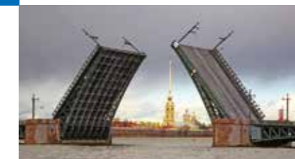
РЕКОНСТРУКЦИЯ ДВОРЦОВОГО МОСТА САНКТ-ПЕТЕРБУРГ

Дворцовый мост был построен в центре Петербурга в 1916 году и стал одним из символов города. Срок эксплуатации моста без капитального ремонта составил 90 лет. В ходе реконструкции была произведена полная замена механизмов и оборудования разводного пролета, реконструкция опор.