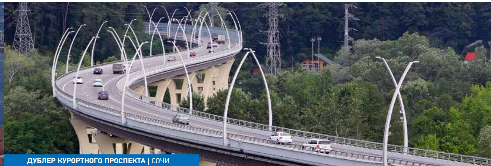
ДУБЛЕР КУРОРТНОГО ПРОСПЕКТА | СОЧИ

Реконструкция магистрали направлена на улучшение транспортной связи центральных регионов России с югом страны. В ходе масштабных работ предусмотрено увеличение пропускной способности магистрали, в том числе за счет создания обходов населенных пунктов и вывода из них транзитных потоков. Комплекс реализуемых мероприятий позволит сократить время в пути, повысит безопасность дорожного движения и сделает дорогу более комфортной для водителей и пассажиров.