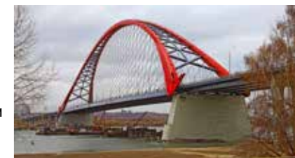
БУГРИНСКИЙ МОСТ НОВОСИБИРСК

Комплекс защитных сооружений представляет собой гигантский и сложнейший гидротехнический объект общей длиной 24,5 км, включающий в себя 11 дамб, 2 судопропускных и 6 водопропускных сооружений. Помимо защиты Санкт-Петербурга от наводнений и регулирования гидрологического режима в акватории Невской губы, комплекс используется как часть Кольцевой автодороги вокруг Санкт-Петербурга. На КЗС «Стройпроект» выполнял функции менеджера проекта — консультанта по техническим вопросам завершения строительства.